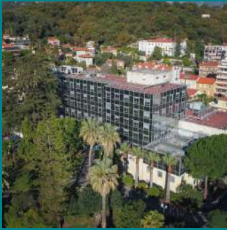
CH La Palmosa de Menton