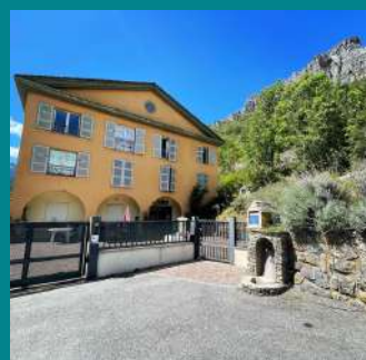
Ehpad Le Touzé de La Brigue