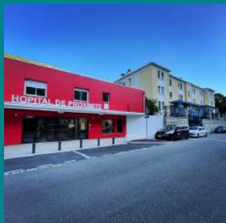
Hôpital de proximité de Breil-sur-Roya