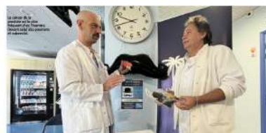
nice-matin menton - photographie LR