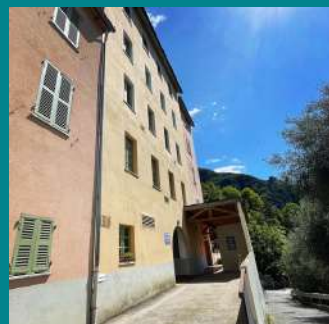
Ehpad Le Temps des Cerises de Saorge