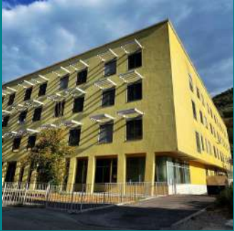
Hôpital de proximité de Sospel