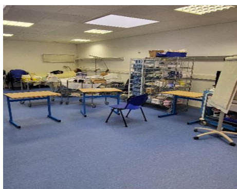
Salle de pratiques